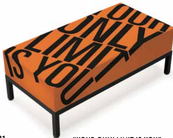
21 "YOUR ONLY LIMIT IS YOU"