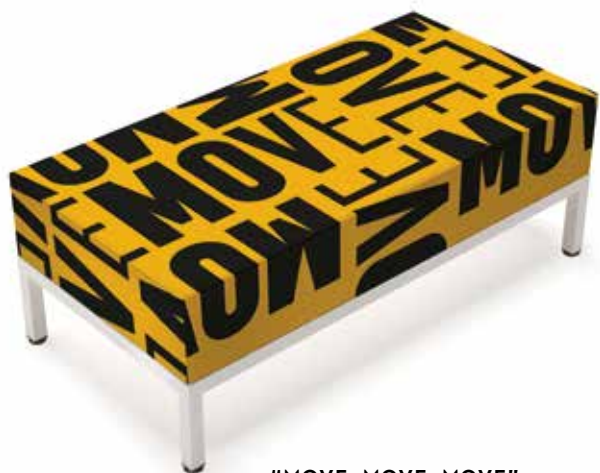
18 "MOVE, MOVE, MOVE"