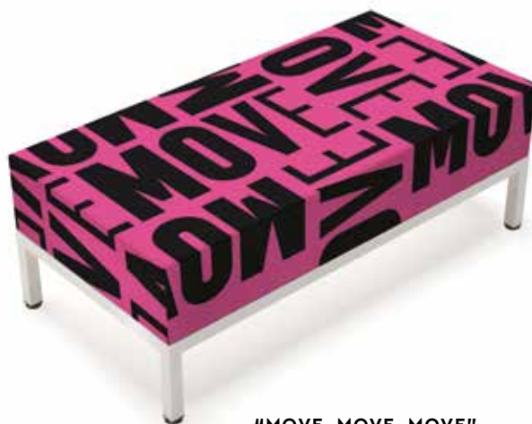
19 "MOVE, MOVE, MOVE"